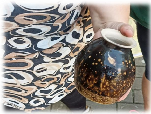
Kurz „Americké raku

Ve školním roce 2021 - 2022 bylo uspořádáno celkem 477 příležitostných akcí pro 15.745 účastníků. Spontánní aktivity navštívilo celkem 28 043 dětí, žáků i dospělých. Zde se jedná především o aktivity spojené se sportováním na Stadionu mládeže, návštěvníky výstav a prezentačních akcí. Významnou aktivitou jsou výukové programy pro děti z mateřských škol i žáky ze škol základních, které jsou pořádány oddělením přírodovědy a keramiky. Těchto programů se v uvedeném školním roce zúčastnilo celkem 2.785 dětí a žáků.