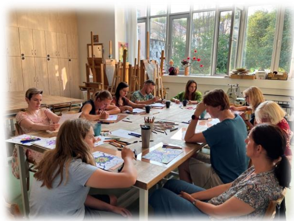
Zájmový kroužek – výtvarný ateliér