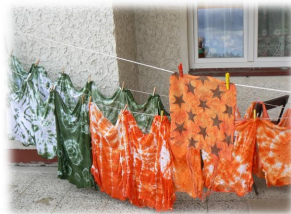
Letní tábor – Barevná dílna Štědronín 2022