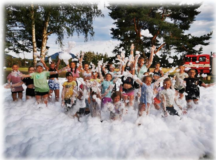
Letní tábor Aerobic summer camp