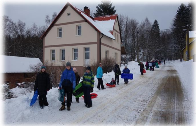
Jarní a podzimní tábor odd.turistiky