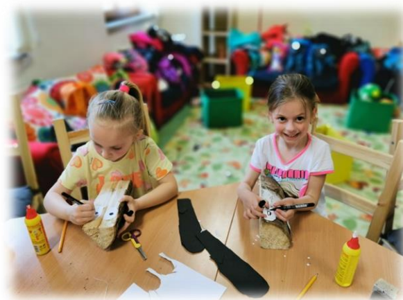
prázdninová aktivita – Velikonoční tvoření