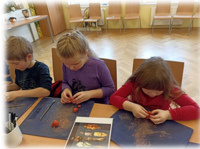
Jarní tábor s dinosaury