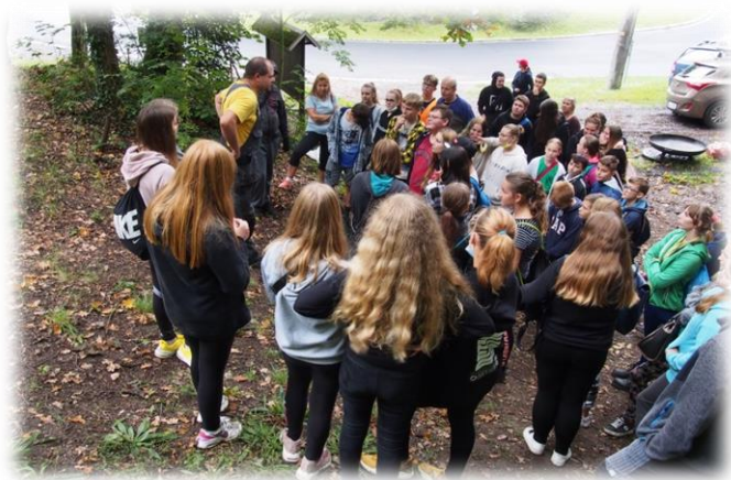
Uklidme svět – Bertino údolí