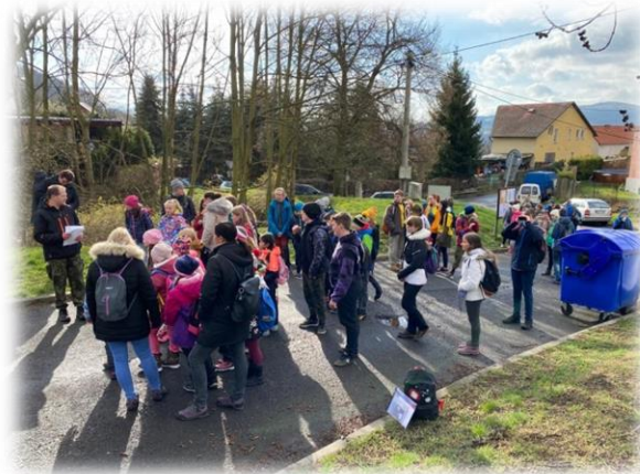
Soutěž Zlatý list